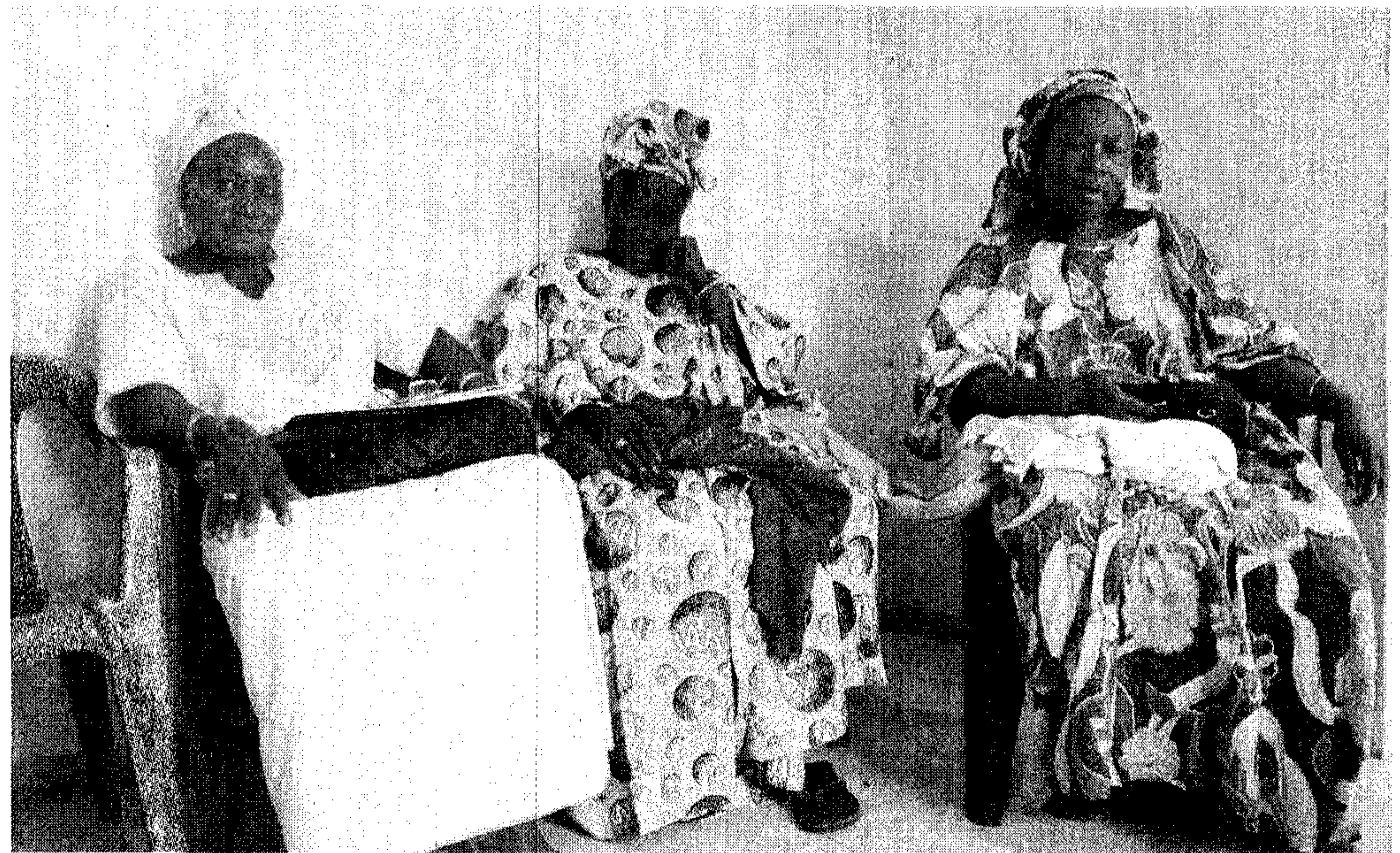
Donne in carriera. La presidente e due socie della cassa rurale di Khombole, nel nord del Senegal